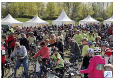
Menschen über Menschen auf der Lübbener Schlossinsel, die beim Spreewaldmarathon dabei sein wollten.

LÜBBEN Die Spreewaldstadt hat sich am Wochenende sportlich, kulturell und kulinarisch präsentiert. Der Spreewaldmarathon, die erste Turmbesteigung mit der neuen Türmerin, die Rudelübergabe und die Kulinarika sorgten für Höhepunkte quasi im Stundentakt. Und lockten Tausende Gäste in die Kreisstadt Lübben.